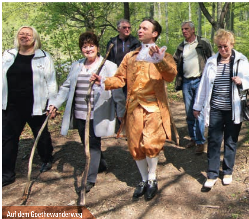
Auf dem Goethewanderweg

Hier geht's zum Wanderbus Goethewanderweg