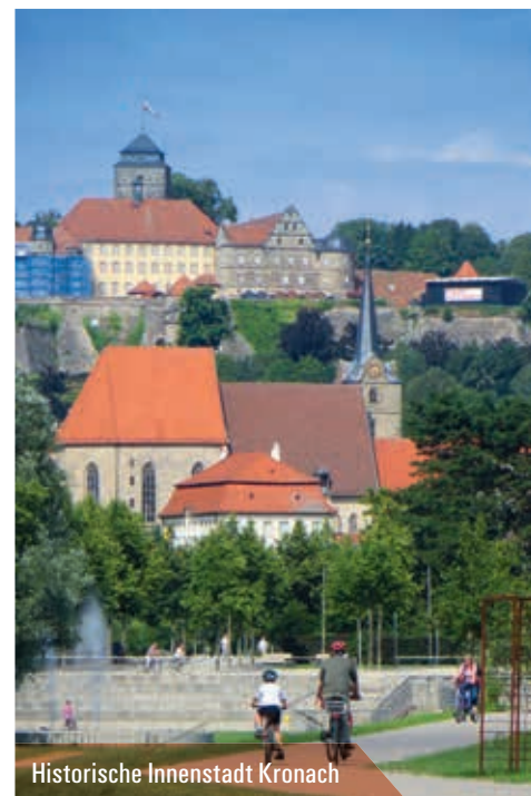
Historische Innenstadt Kronach

An den Wochenenden vom 1. Mai bis 31. Oktober 2018 verkehrt die Thüringer-Meer-Linie von Bad Lobenstein nach Nordhalben, dem Ausgangspunkt zahlreicher Radtouren und Wanderungen mit Anschluss an Bayerns größtes zusammenhängendes Fahrradbusnetz „Frankenwald- & Fichtelgebirge-mobil“. Von Nordhalben in Oberfranken fährt die Thüringer-Meer-Linie an den Bleilochstausee am Thüringer Meer. Zahlreiche touristische Highlights und Attraktionen gibt es auf thüringischer und bayrischer Seite. Besonders entdeckenswert sind die einstige Reußische Residenz Schloß Burgk, der Landschaftsgarten in Ebersdorf und die historische Innenstadt Kronachs. Nostalgie erfährt man in der Rodachtalbahn oder man erlebt pure Entspannung im natürlichen und gesunden Thermalwasser und Naturmoor der Ardesia-Therme.