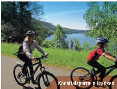
Kordeltalsperre in Franken

Ab dem 1. Mai 2018 rollen die RadBusse der KomBus wieder auf den Straßen der Landkreise Saalfeld-Rudolstadt und Saale-Orla, fahren nach Jena, Gera, Erfurt, Weimar, Ilmenau und Neuhaus am Rennweg und starten zu den Ausgangspunkten der schönsten Radtouren der Umgebung.